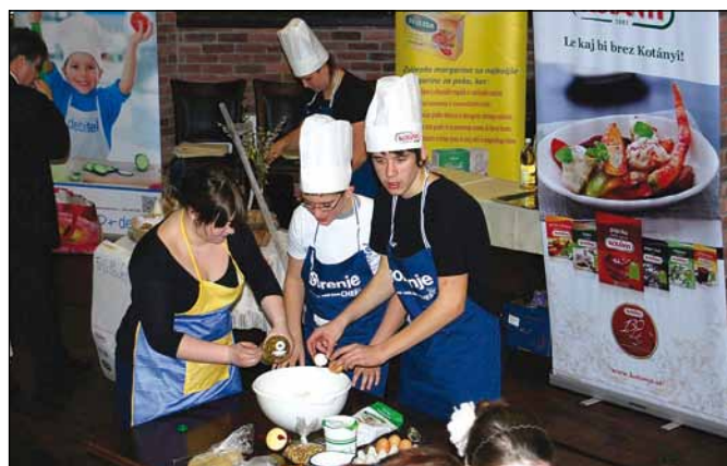
Štrukeljčki v akciji.