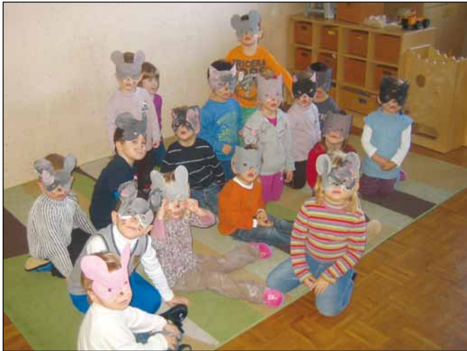
Najprej smo bili miške in muce,