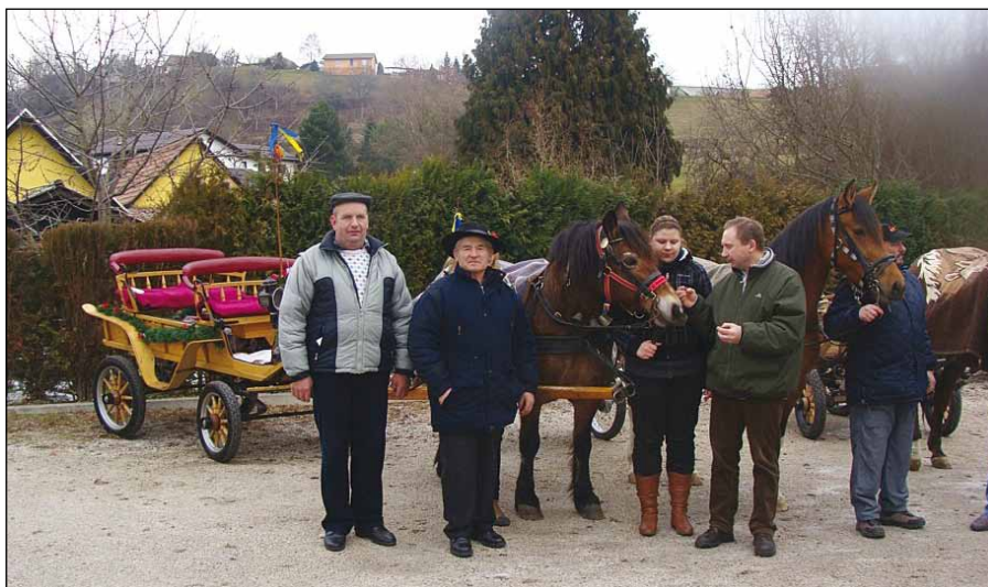
Blagoslov konj v Dvorjanah.