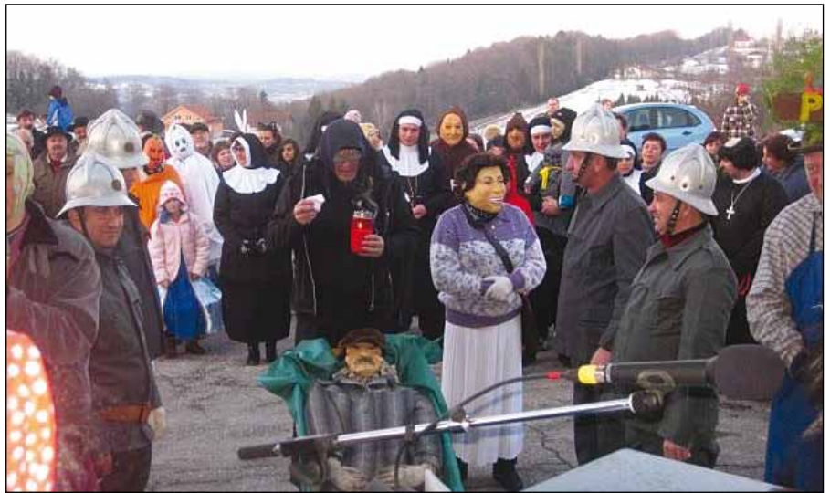
Obsojen na sežig.