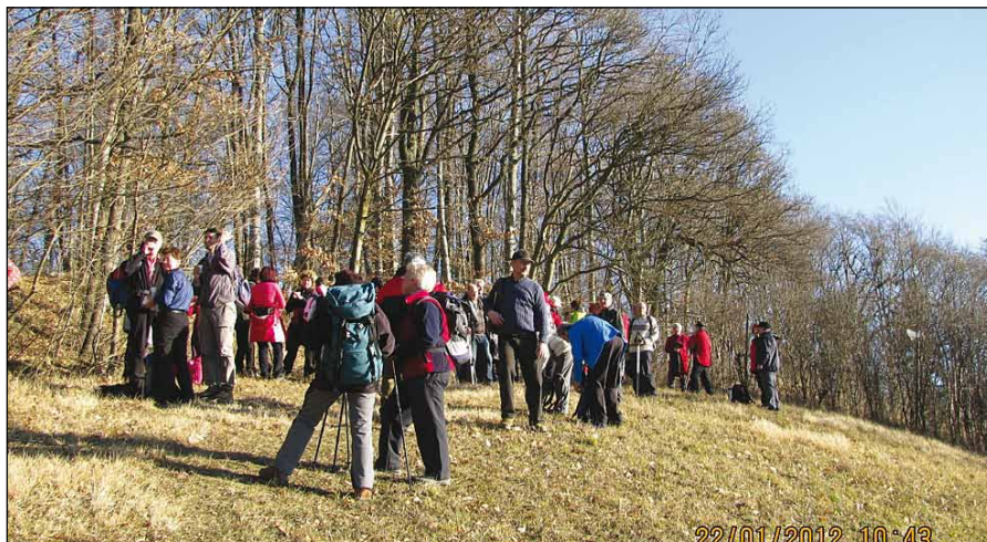
Pot nas je vodila skozi lepe predele Kamenščaka.

Informacije in rezervacija vstopnic: 031/660 – 112.