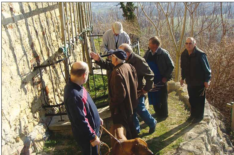
Strokovni rez potomke Stare trte na Vurberku.