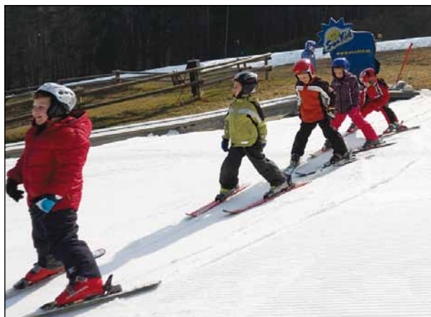
Priprave na snegu