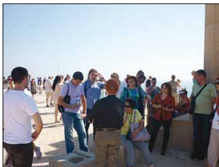
Obisk akropole v Lindorju

Drugi dan srečanja je bil namenjen študijskemu obisku. Obiskali smo znamenito zgodovinsko svetišče Lindor in istoimensko srednjeveško naselje. Sledil je ogled starega mesta Rodos z vhodnimi vrati in obrambnim jarkom, veliko palačo in ulico Knight. Zadnji dan našega srečanja je bila organizirana evalvacijska delavnica. Razpravljali smo o predstavljenih kulturnih znamenitostih, njihovi predstavitvi, pomanj-