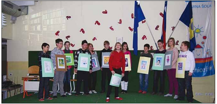
Dramatizacija učencev 6. a

V ponedeljek, 6. februarja 2012, so imeli učenci tretje triade OŠ Duplek kulturni dan, ki je bil med drugim namenjen počastitvi slovenskega kultur-