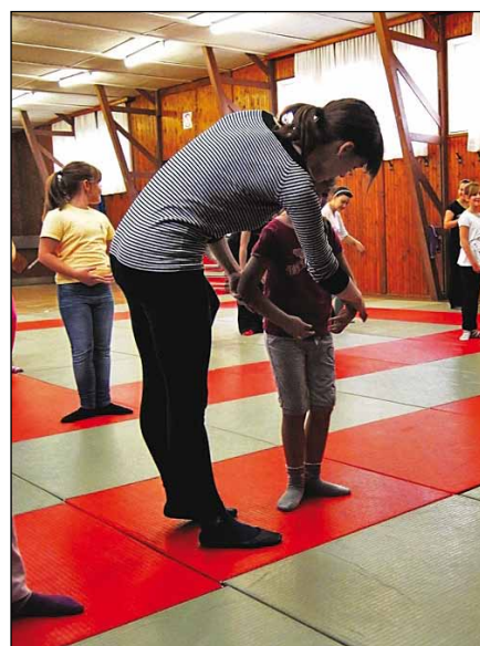
Postavitev rok in nog

Tako smo med počitnicami v »baraki« več dni imele plesno-mažoretno delavnico. K našim uram se je lahko vpisala katerakoli učenka, ki se je želela naučiti osnov baleta, sambe in mažoretne tehnike. K sodelovanju smo povabili večletno plesalko baleta, ki nas je naučila osnovnih baletnih izrazov, korakov in baletnih pozicij. Ugotovile smo, da nam lahko balet pomaga pri pravilni telesni drži, zato ga bomo vadile tudi v prihodnje. Za fotografije je poskrbela Andreja Berlič, ki se je z nami družila pri baletni uri. Več o naših nastopih in delovanju