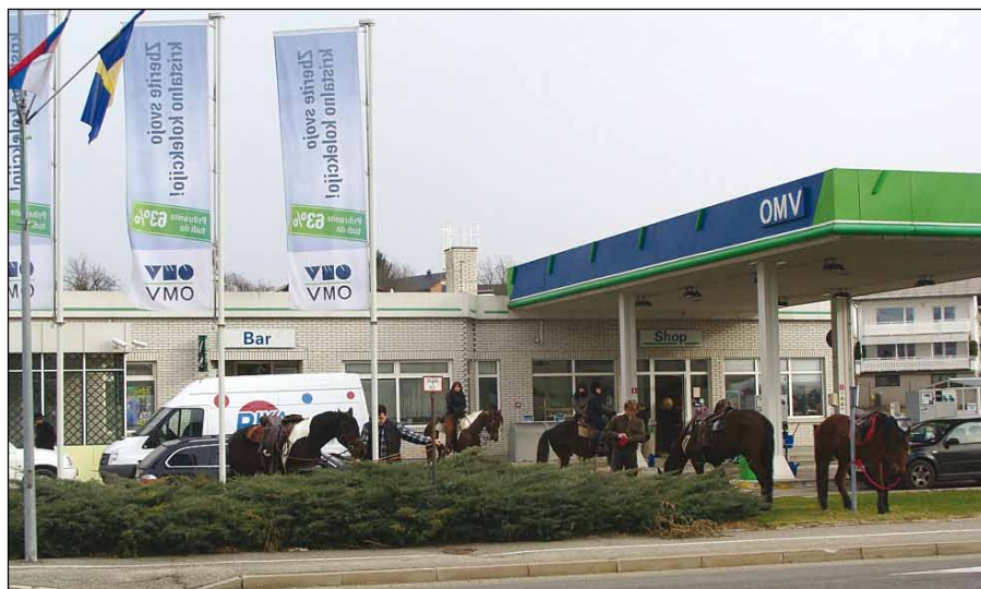
Obisk konjske sile pri konkurenci (pod pokrovom motorja) na bencinskem servisu.

knjige. Številka je nekaj nad 23.000 živali. Največ je hladnokrvnih pasem, posavska in haflinška pasma ter kasaški konji, manjši pa je delež drugih pasem. Rodovniške knjige vodijo republiške strokovne službe v konjereji, ki so odgovorne tudi za čipiranje. Sodelujejo z rejskimi organizacijami po Sloveniji in pomagajo pri izvajanju rejskih programov. Pravila za vpis v rodovniško knjigo so stroga, potrebno je znano poreklo staršev (še posebno pri avtohtonih lipicancih). Sicer pa veljajo vse strožji predpisi za vzrejo vseh vrst kopitarjev, predpisuje jih uredba Evropske komisije. Identifikacija živali je pri tem prva obveznost.