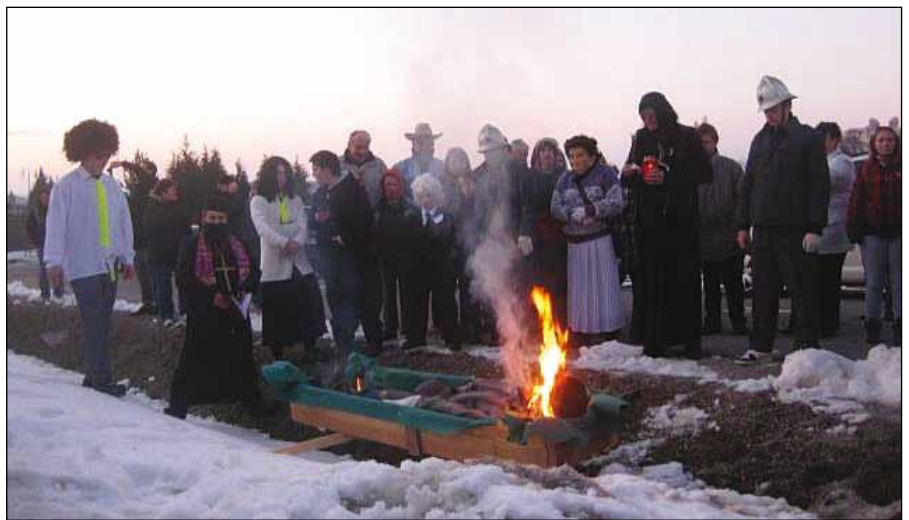
Izvršitev obsodbe.