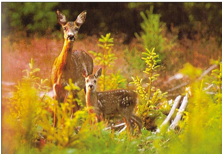
Srna z mladičem.

Za vse obiskovalce in sprehajalce v našem lovišču, ki jih je zaradi toplejšega vremena iz dneva v dan več, pa naslednje: visoke preže kot razgledne točke