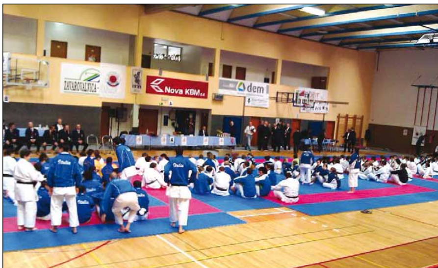
Tekmovalci pred otvoritvijo tekme.