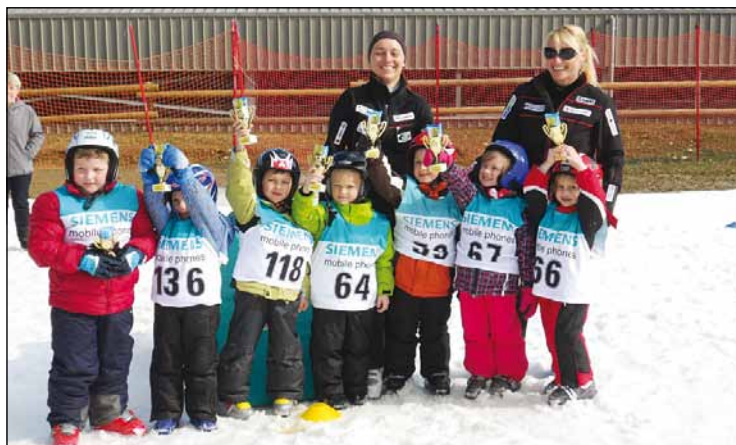
Podelitev pokalov za uspešno smučanje