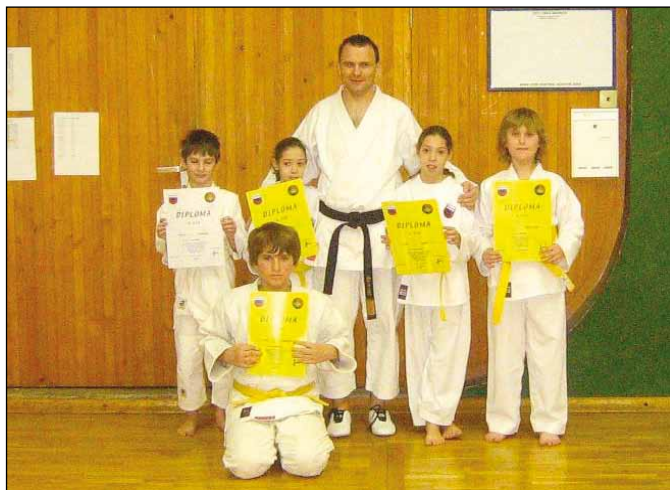
Slika s polaganja pasov

Čestitamo vsem za uspešno opravljene izpite!