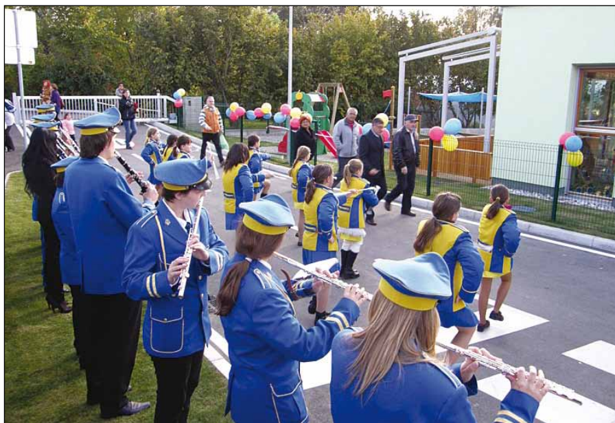
Pihalni orkester in mažoretke med nastopom na otvoritvi vrtca v Zg. Dupleku

se otroci tega navadijo in naučijo, saj imajo kasneje manj težav.