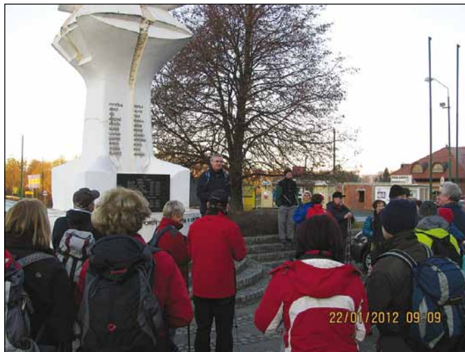
Govor pri spomeniku v Zg. Dupleku: Župan občine Miklavž je vsem pohodnikom zaželel lep pohodniški dan.