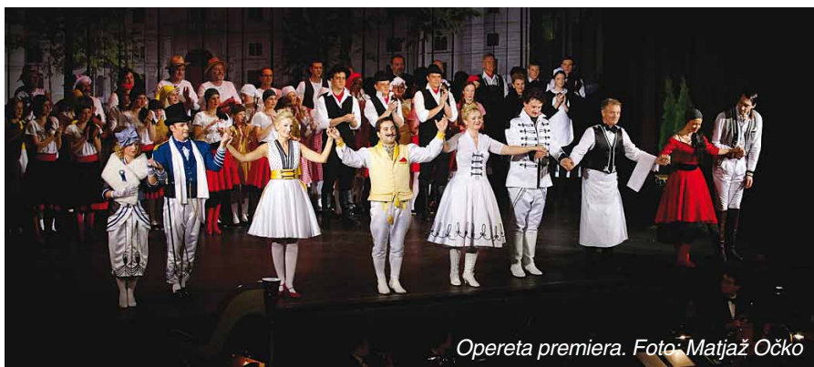
Opereta premiera.

Béla Törek, novi oskrbnik na posestvu bogate madžarske grofice Marice, je v resnici grof Tassilo Endrödy-Wittenburg, ki je moral prodati vse svoje imetje, da je lahko odplačal dolgove pokojnega očeta. S službo oskrbnika se trudi zaslužiti dovolj, da bi lahko zagotovil doto sestri Lizi. Na prizorišču se pojavi knez Dragomir Moritz Populescu, ki najavi grofičin prihod ter njeno zaroko. Grofica Marica je naveličana neprestanega dvorjenja moških, ki si želijo zgolj njenega premoženja. Zato si je preprosto izmislila zaroko z imaginarnim baronom Kolomanom Zsupanom, čigar ime je povzela po Straussovi opereti Cigan baron . Na njeno presenečenje pa na praznovanje zaroke zares pridrvi prašičjerejec Koloman Zsupan iz Varaždina, ves navdušen nad tem, da se bo poročil z grofico. Mnogo manj vneta je Marica, ki je še vedno prepričana, da se ne bo poročila. Med grofičinimi spremljevalci je tudi Tassilova sestra Lisa, ki jo brat prepriča, da molči o njegovi pravi identiteti.