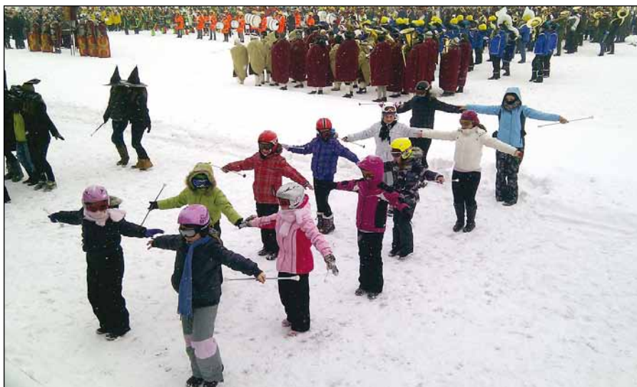
Smučarke ob skupinskem nastopu na Ptuj. V ozadju pihalni orkestri

tev, in sicer kurentovanja na Ptuj in pustne povorke v Dupleku.