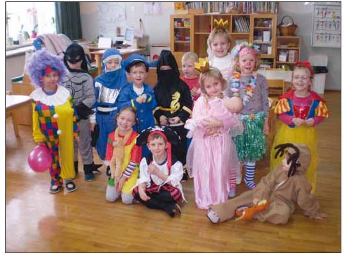
nato pa vse sorte - po gasilsko