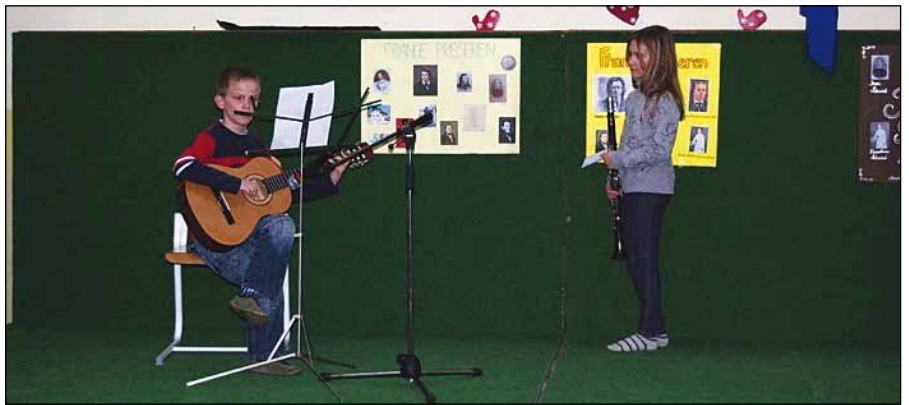
Prireditev sta popestrila tudi učenca 4. a