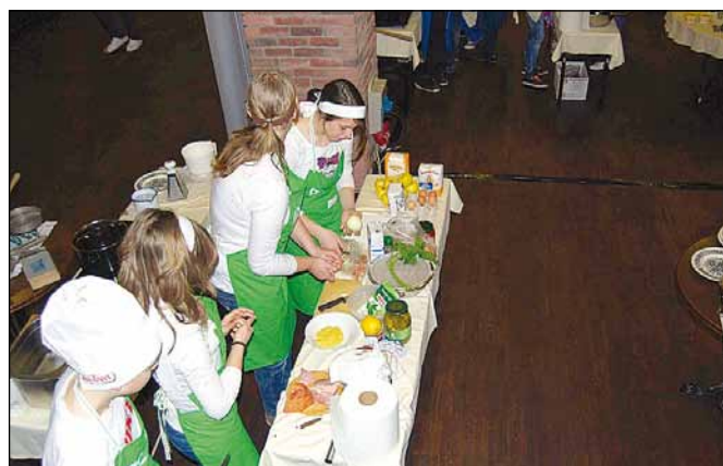
Fižolčki že kuhajo.