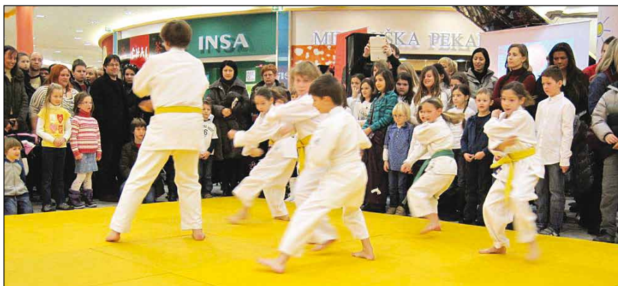
Naši karateisti med nastopom