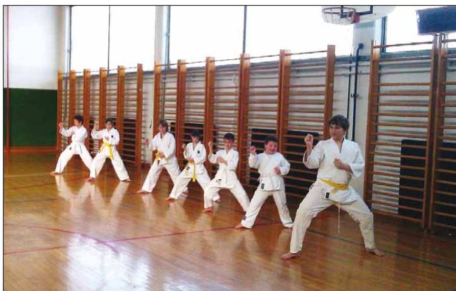
Med počitnicami ne počivamo.