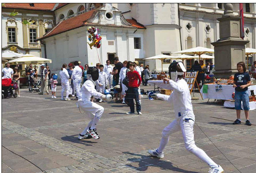
Sabljanje v Mariboru.