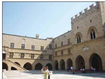
Velika palača Rodos