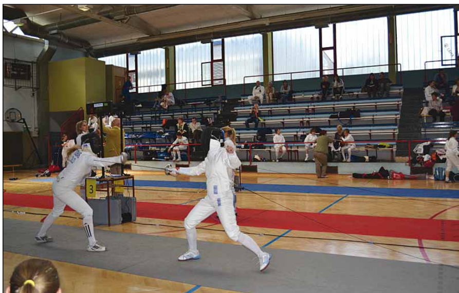
Pravila so jasna: veljajo zadetki, ki nasprotnika zadenejo v roke, telo ali glavo.

Ko opazujemo aktivnost športnika v sabljaški borbi, zaznamo hitrost, nepričakovane spremembe smeri in akcij. Izredno pomembna je natančnost gibanja. Sabljač nenehno reagira na nepričakovane akcije in dejanja nasprotnika. Borba zahteva hitro presojanje situacije in izkoriščenje vseh borilnih sredstev, ki ustrezajo situaciji. V sabljanju je ob tehniki veliko psihologije in taktike, prenašanja telesne teže in obvladovanja določenih gibov. Tudi pri sabljanju lahko tekmovalec dobi rumeni karton (opozorilo za napako), rdeči karton (ko prejme drugega rumelega, kar nasprotniku prinese točko) in črni karton (za težje kršitve in po-