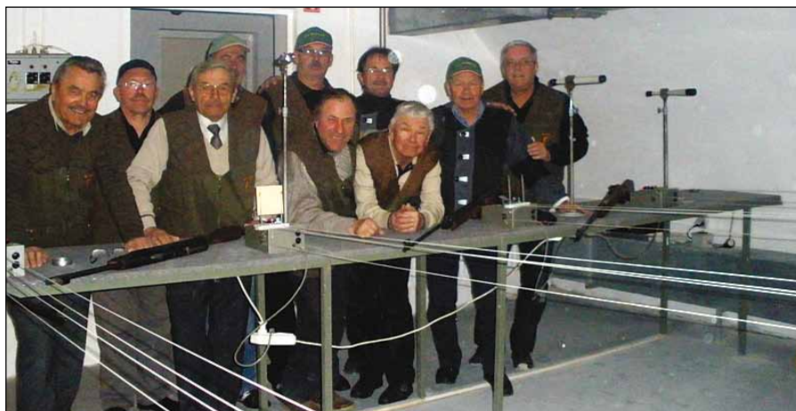
Strelci DU Duplek.

Obveščamo vas, da imamo na voljo svoje štiristezno strelišče v kletnih prostorih OŠ Dvorjane. Vabimo vse