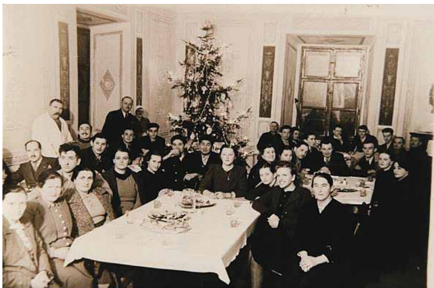
Zaposleni so poskrbeli za prijetno vzdušje.