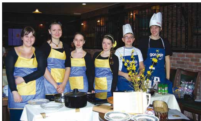
Skupina Štrukeljčki pripravljena na kuhanje.