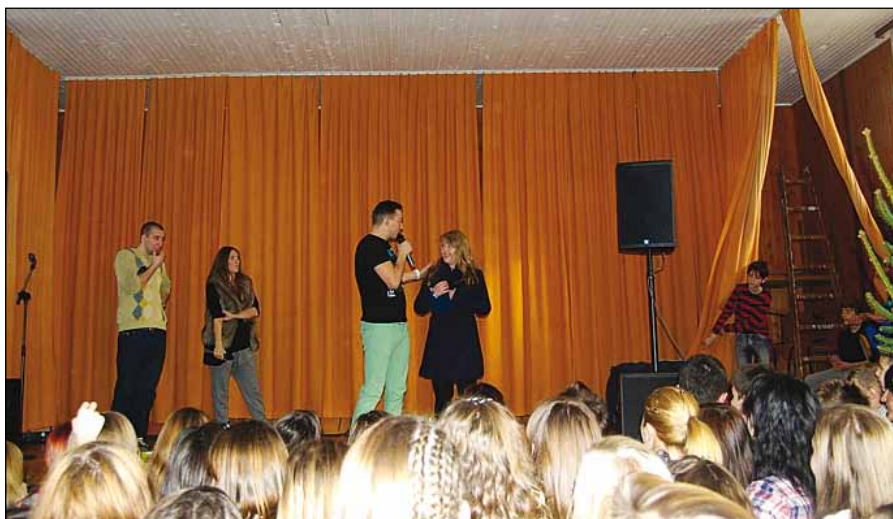
Novinarja Radia City in učenci