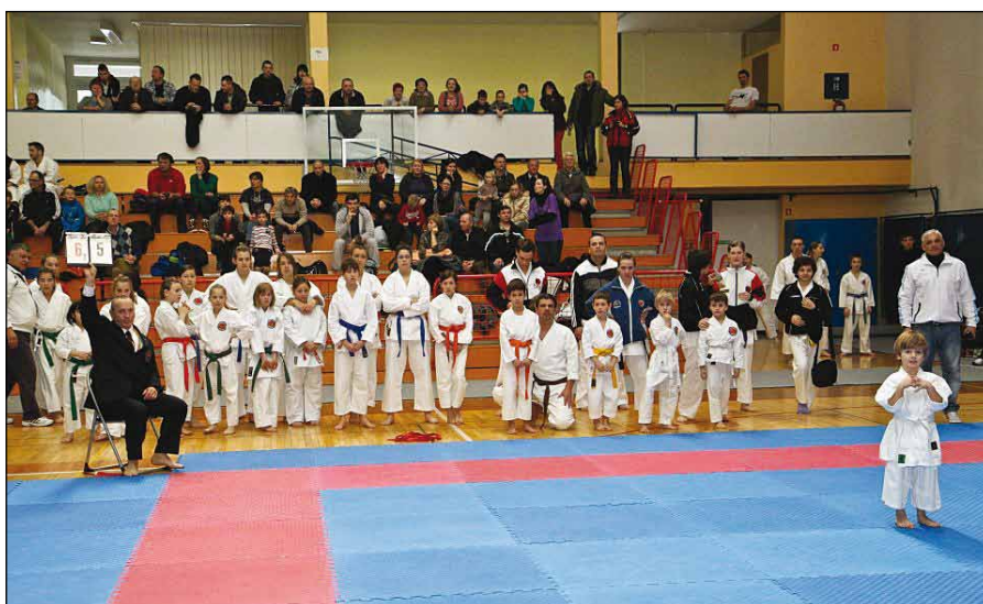
Nastopili so tudi najmlajši.