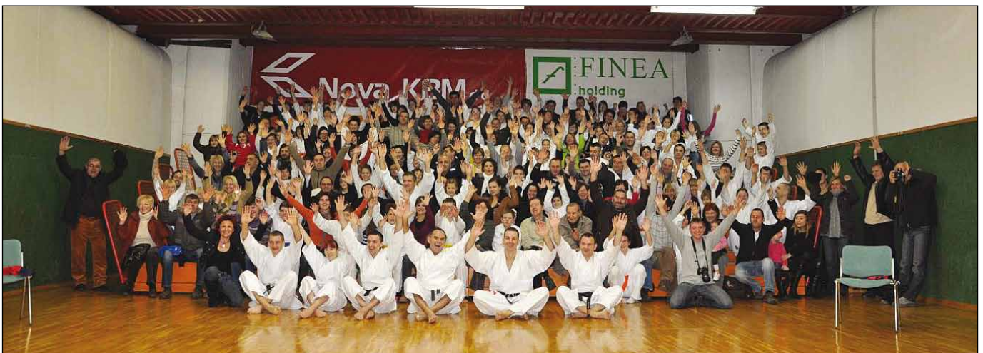
Skupna slika s tekmovanja