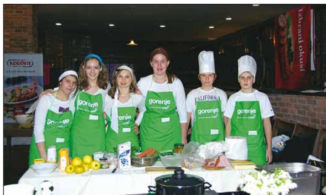
Skupina Fižolčki na tekmovanju.